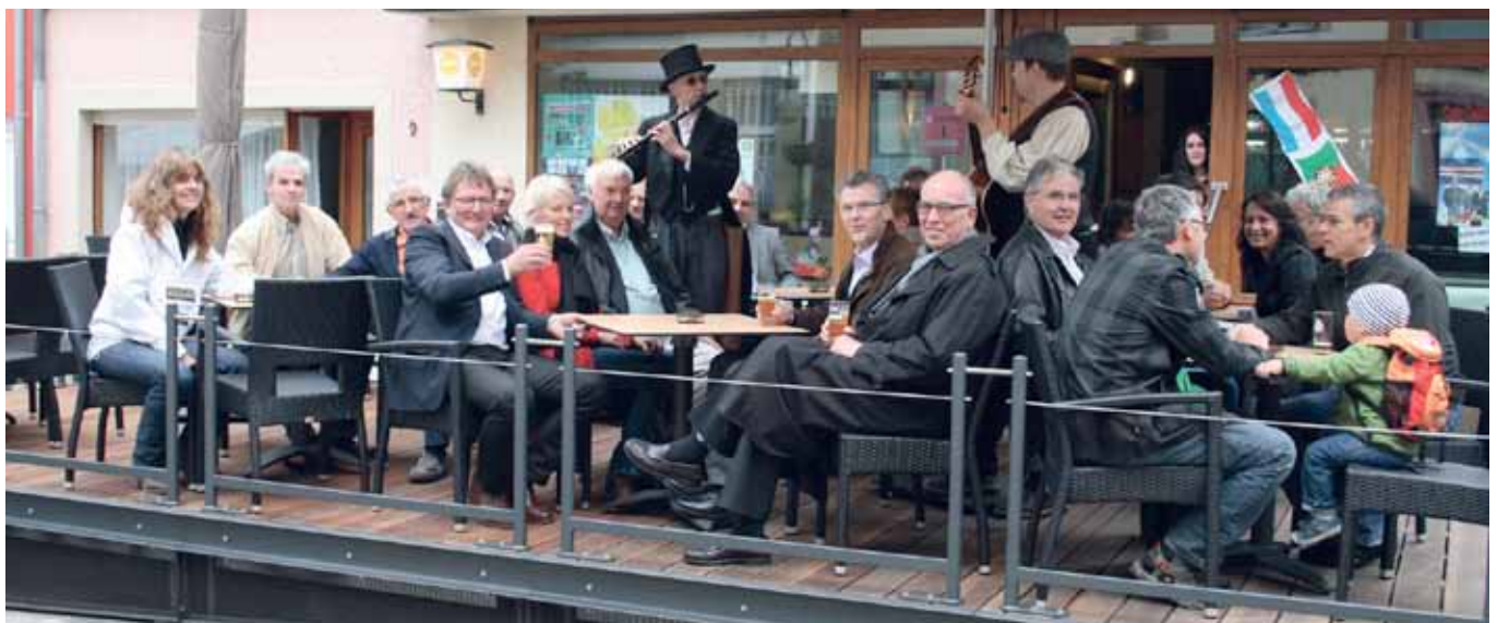
► Sie waren bei der Eröffnung der Terrassen dabei

Am 27. Mai fand die offizielle Eröffnung der neuen Außenterrassen in der „Groussgaass“ und der „Scheergaass“ statt. Hierzu Fabienne Scheer im „t“ vom 30. Mai: In naher Zukunft sollen sich die Wiltzer Haupteinkaufsstraße und die „Rue des Tondeurs“ zu einer „Shared-Space-Zone“ entwickeln. Das soll heißen, dass beide Straßen den Anschein eines Stadtkerns erwecken sollen, in dem sich die Bewohner wohlfühlen und sich auch einmal an freien Nachmittagen zu einer Tasse Kaffee und einem Stück Kuchen zusammenfinden. (...) Restaurateure und Barbesitzer kamen in den Vorzug, sich für eine geringe Selbstbeteiligung neue Terrassenmöbel aussuchen zu dürfen. Außerdem erhielten alle Außenterrassen genau zugeschnittene Holzplattformen, um zu verhindern, dass ihre Besucher später zwar auf schicken Sesseln, aber schräg sitzend in den Genuss ihres Eisbechers kommen würden. Dort, wo einst Pfeiler standen, wurden große Kübel gesetzt. (...) Die Terrassen sollen bis Oktober 2011 stehen bleiben und dann nach der Winterpause im April 2012 wieder öffnen.