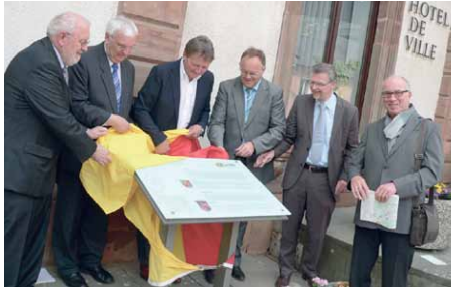
► Der Kulturweg wird eröffnet

Trotz erfolgreich abgeschlossener Standortsuche mit einem geeigneten Terrain in der neuen Industriezone teilte die Post Anfang des Jahres der Gemeinde Wiltz in einem offiziellen Schreiben mit, dass sie das Postverteilerzentrum nicht in Wiltz bauen würde. Wie hierin präzisiert wurde, habe sich nach intensiven Überlegungen