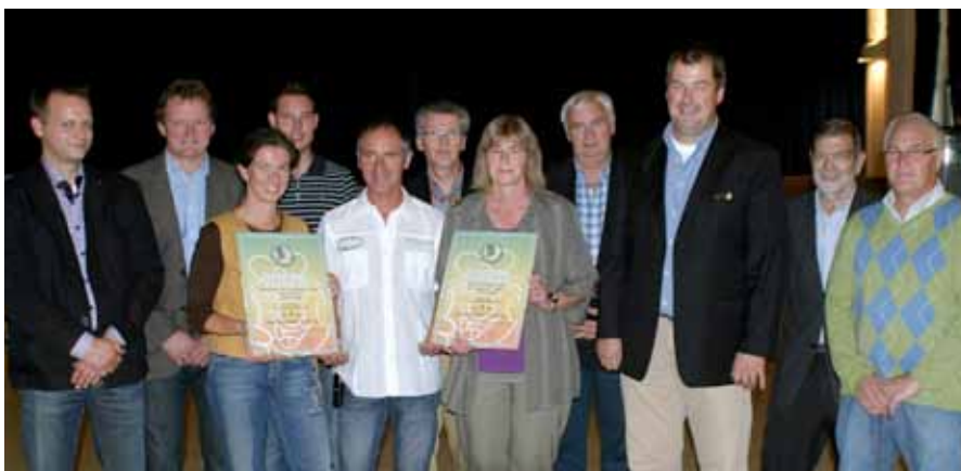
► Wiltzer Schulen werden von der Initiative „SuperDrecksKëscht“ ausgezeichnet

Der Organisator und die vielen Besucher zeigten sich überrascht über die stattliche Menge von Material, das sich über die Jahre in den Fotoalben ehemaliger und heutiger Turner gesammelt hatte. Auf die Ausstellung folgten ein Konveniat und die Herausgabe einer Broschüre. Turnvereine gab es in Wiltz seit 1909, wo „La Persévérante“ in Oberwiltz gegründet wurde, auf die die 1912 die Niederwiltzer „L'Hirondelle“ folgte. 1981 fusionierten die