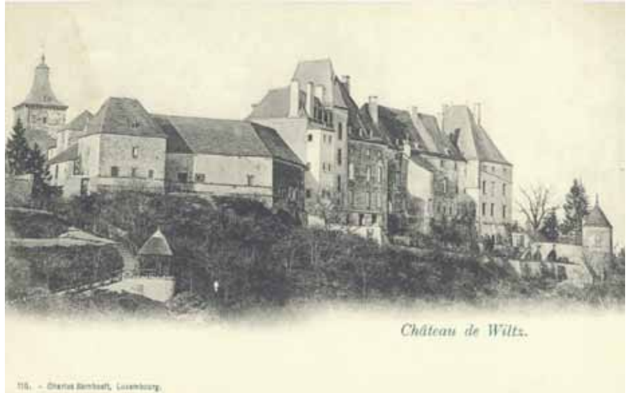
► Das Schloss vor ca. 100 Jahren (von Süden her geknipst), ganz links: der quadratische Turm, ganz rechts: der Hexenturm

Vorgesehen waren u.a. 2 Mio. € für weitere Ausbauarbeiten am Rettungszentrum, 800 000 € für den Ankauf des Hauses 12 in der „Rue du XSeptembre“ zur Schaffung von 79 Kinderbetreuungsplätzen, 940 000 € für den Abschluss der Sanierungsarbeiten in der „Avenue de la Gare“ und „Rue Michel Thilges“, 776 000 € für die Fertigstellung