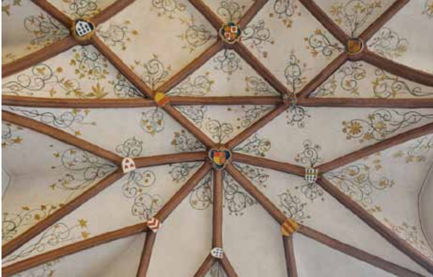
► Das Sternengewölbe im alten Chor der Dekanatskirche