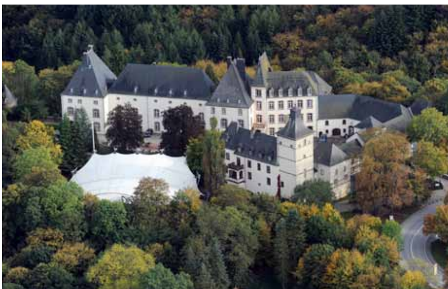
► Das Schloss heute (von Norden her gesehen)

Nachdem das Schloss jahrzehntelang in Privatbesitz gewesen war und bis nach dem Zweiten Weltkrieg teilweise den Schwestern der christlichen Lehre als Mädchenpensionat (1851-1950) gedient hatte (erstes Pensionat des Landes), wurden die Gebäude 1951 vom Luxemburger Staat erworben, der darin ein Altenheim errichtete, das bis 1985 von den