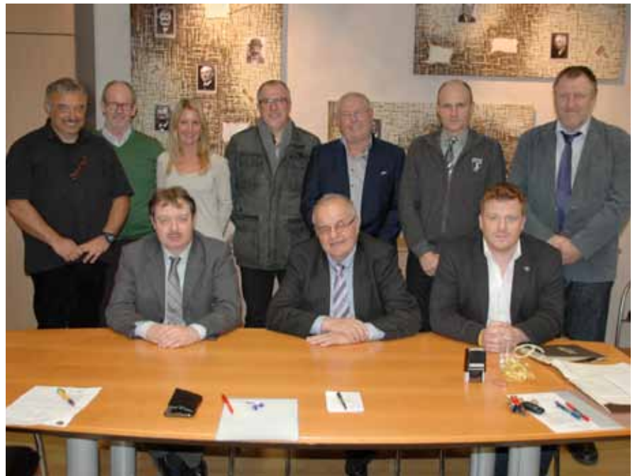
► Am 27. Dezember fand die letzte Sitzung des Gemeinderates Eschweiler statt