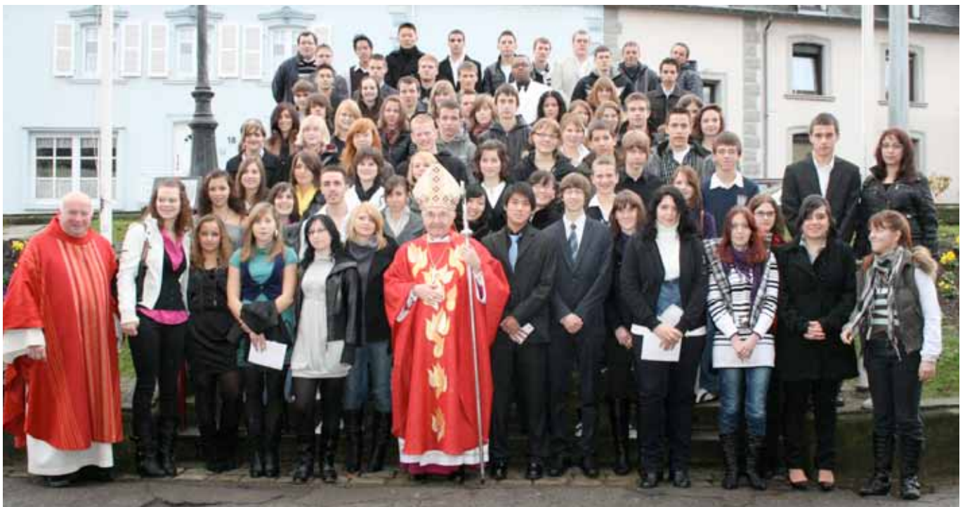
► Sie wurden 2009 in der Dekanatskirche gefirmt