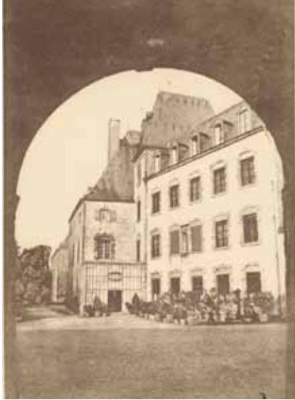
► Von 1851 bis 1950 befand sich ein Pensionat im Schloss