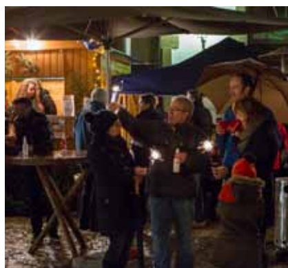
► Chrëschtmoart 2014