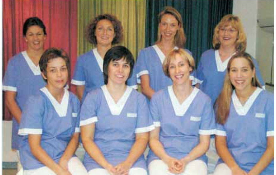
► Das Personal der Wiltzer „Maternité“ im Jahr 2003

Nachdem ein Verkauf des Schlosses bereits seit Dezember 2010 definitiv vom Tisch war, beschloss der Gemeinderat in der Sitzung vom 27. Juli einstimmig, das historische Gemäuer zu mieten, und zwar zu den Bedingungen, die zwischen