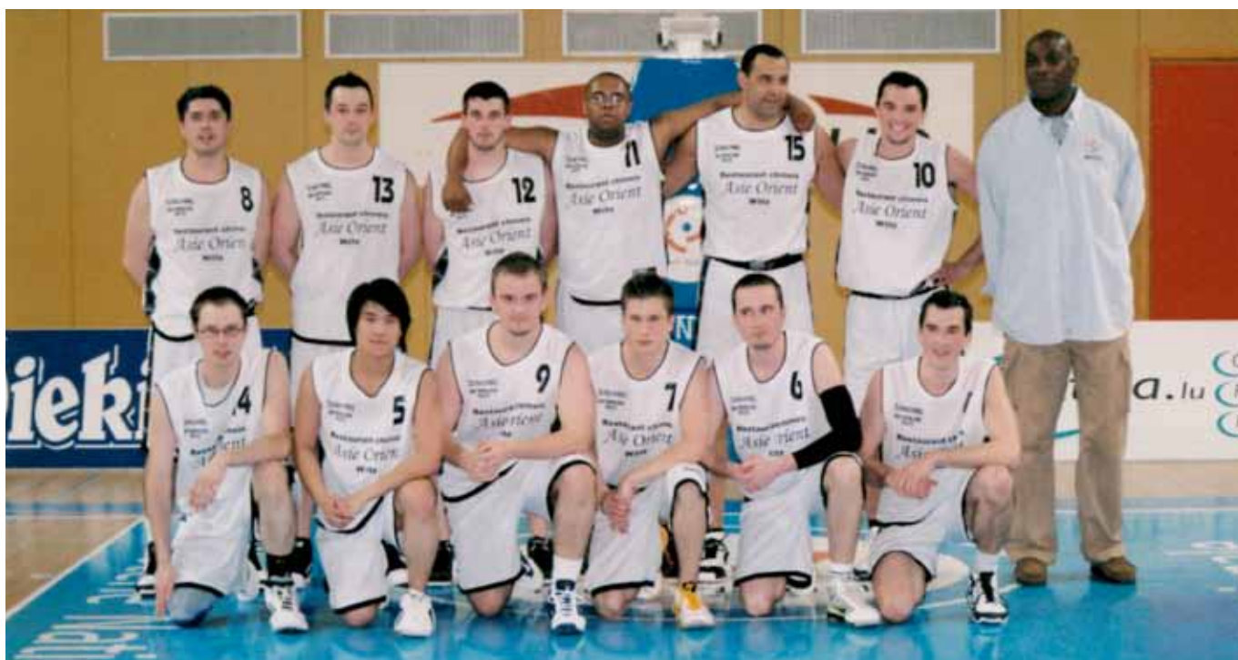
► Die Herren der BBC „Les Sangliers“ standen 2011 im Finale der „Coupe FLBB“