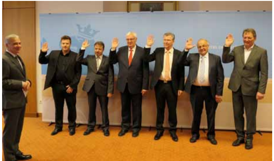
► Vereedigung vum neie Schäfferot vun der Gemeng Wooltz

wécklung vun deenen verschidde regionale Kompetenzpolen vun der Stad a Gemeng Wooltz.