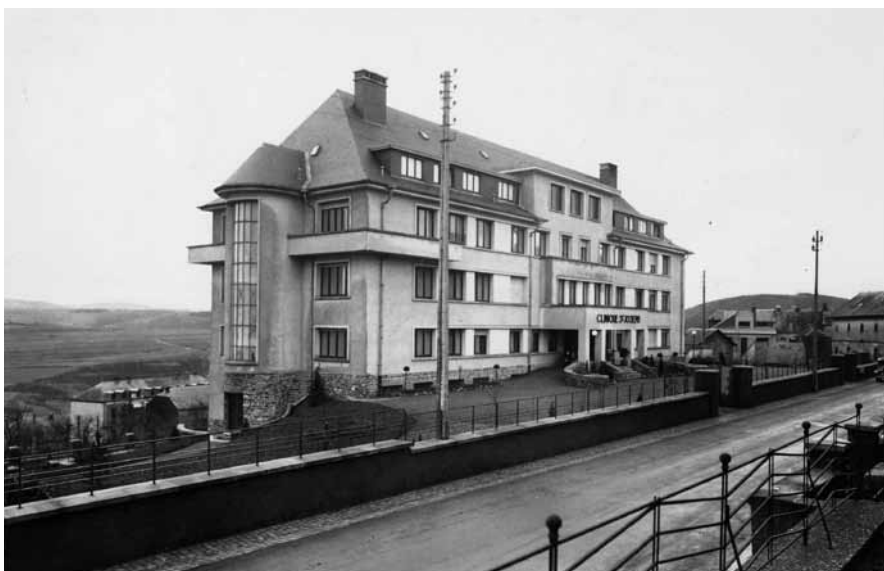
► Die „Clinique St-Joseph“, als sie 1937 eingeweiht wurde

Besorgt zeigten sich auch die Rettungskräfte, die darauf hinwiesen, dass die meisten Patienten an der Nordspitze darum bitten würden, in Wiltz behandelt zu werden, da sie die dortigen Ärzte seit langem kennen und schätzen würden. Das Wiltzer Krankenhaus müsste zumindest ein „Hôpital de proximité“ für die ansonsten noch stärker benachteiligte Nord-Bevölkerung bleiben. Daneben wiesen die Einsatzkräfte darauf hin, dass es nun immer wieder vorkäme dass in Ettelbrück alle Betten belegt seien, weshalb man