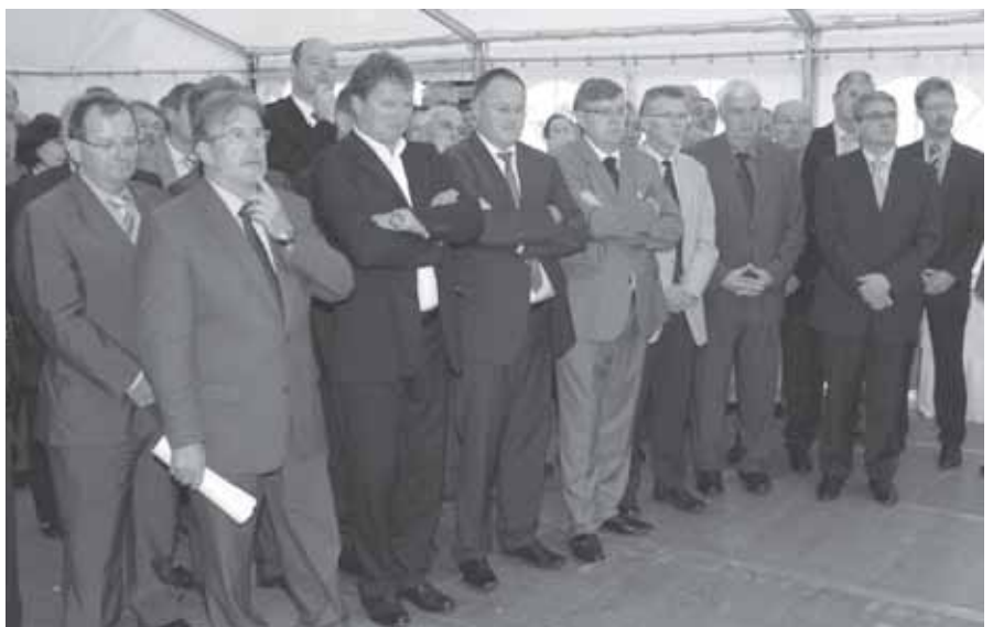
► Bei der Einweihung des Anbaus

Die Gebäudeteile C und D wurden im September 2009 fertiggestellt. Um die Sicherheit der Schüler, der Lehrerschaft und des Personals zu gewährleisten, war inzwischen eine überdeckte Passage entlang des Gebäudes E errichtet worden. Bereits 2007 war eine Holzbrücke gebaut worden, um zu verhindern, dass die