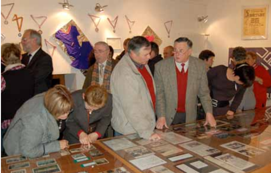
► Ausstellung „100 Jahre Wiltzer Turner“

beiden Vereine und bildeten die „Société de Gymnastique“ Wiltz.