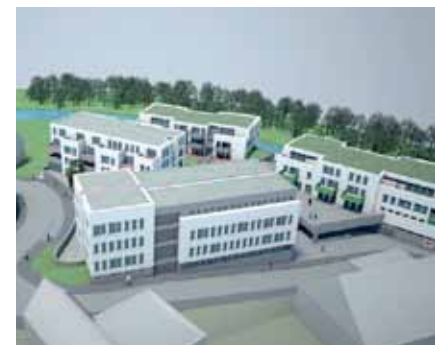
► So könnte das „Monopol“-Gelände einmal aussehen

Einstimmig forderten die Volksvertreter, den Bereitschaftsdienst der „Polyclinique“ in Wiltz im Interesse der Bevölkerung des ganzen Nordens wieder uneingeschränkt zu garantieren resp. die Schaffung einer „Maison médicale“ in Wiltz in Betracht zu ziehen. Diese Beschlussfassung wurde von sämtlichen Nordgemeinden unterstützt. (Anm.: Und es nutzte nichts, wie wir später erfahren werden.)