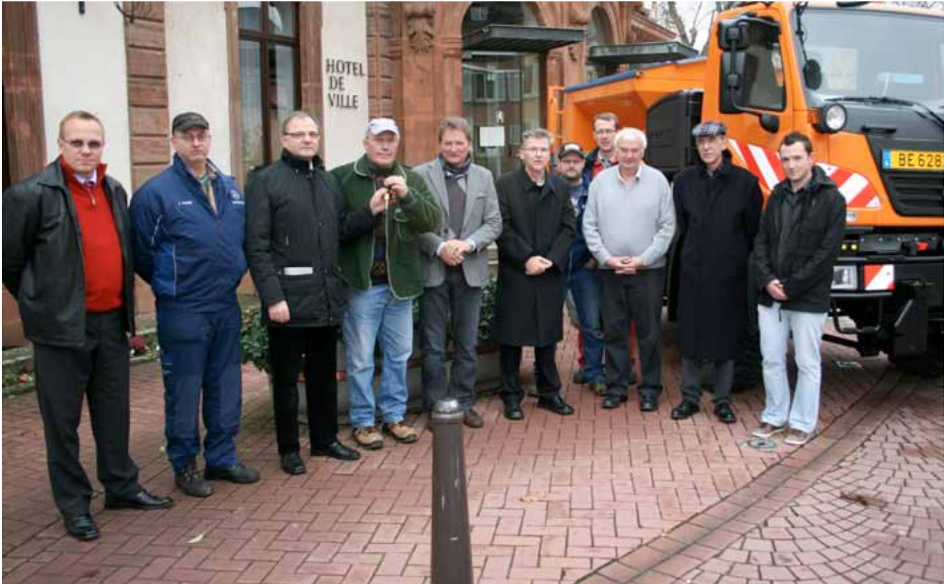
► Der neue Unimog ist da

Die vom Wiltzer Syndicat d'Initiative organisierte „ Marche populaire “ kannte einen regen Zuspruch. Bei herrlichem Herbstwetter taten nicht weniger als 330 Teilnehmer etwas für ihre Gesundheit. Mehr als entschädigt für ihre Anstrengungen, über 7, 12 oder gar 20 km, wurden sie mit unvergleichlichen Ausblicken auf das Tal der „Wiltz“.