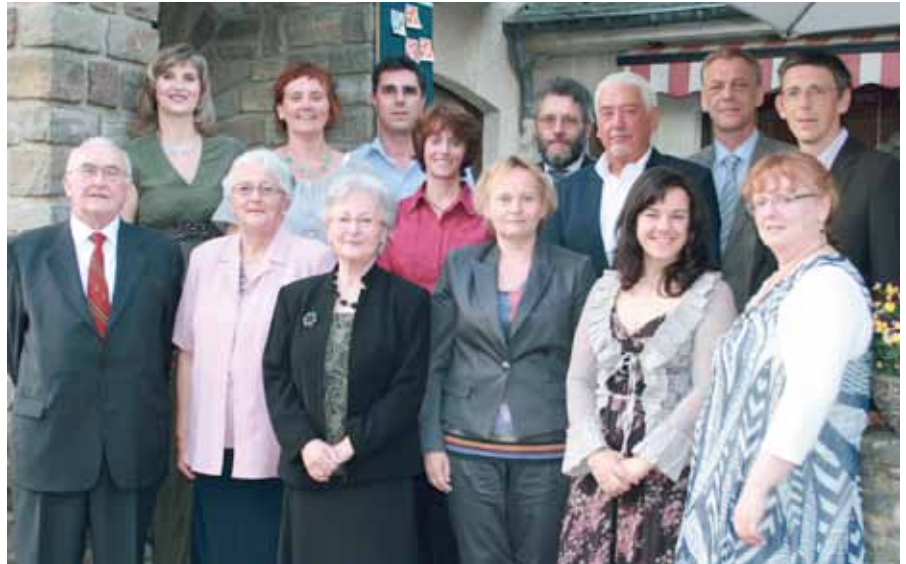
► Silbernes Jubiläum der „Amicale de la Maison de Soins“

Ende Juli feierte das Werk No-Nail Boxes seinen 50. Geburtstag. Aus dem Hersteller von Sperrholzkisten war mittlerweile eine Unternehmensfamilie geworden. 2010 hatte das Unternehmen einen Umsatz von 6,6 Millionen Euro, vor allem mit seinem Produkt: Sperrholzkisten