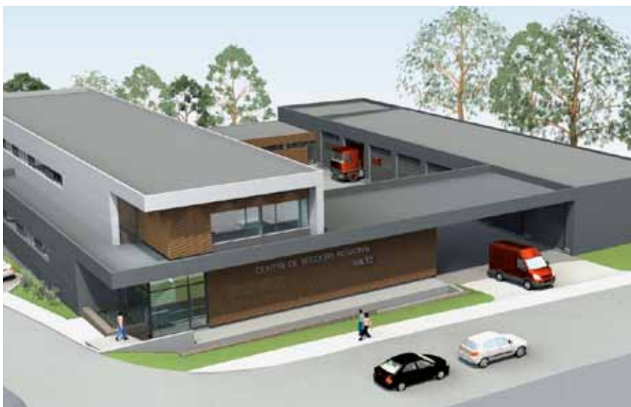
► Grafik des neuen Einsatzzentrums

In der Sitzung vom 6. Januar hatte der Wiltzer Gemeinderat beschlossen, einen gestaffelten Wasserpreis einzuführen, mit dem Prinzip, dass derjenige, der sparsam mit dem Trinkwasser umgeht, weniger pro Kubikmeter bezahlt als derjenige, der es verschwendet. In der Sitzung vom 31. Mai erfuhren die Räte, dass Innenminister Jean-Marie Halsdorf den Wiltzer Vorstoß abgelehnt hatte. Es habe wohl keinen Zweck, sich auf langwierige Konfrontationen mit dem Ministerium einzulassen, so Bürgermeister Fränk Arndt, auch wenn er überzeugt sei, dass es keine gesetzliche Grundlage für die Ablehnung der Wiltzer Initiative gebe. Da der Wasserpreis ab dem 1. Januar 2011 kostendeckend verrechnet werden müsse, bleibe nun jedoch keine Zeit mehr zu