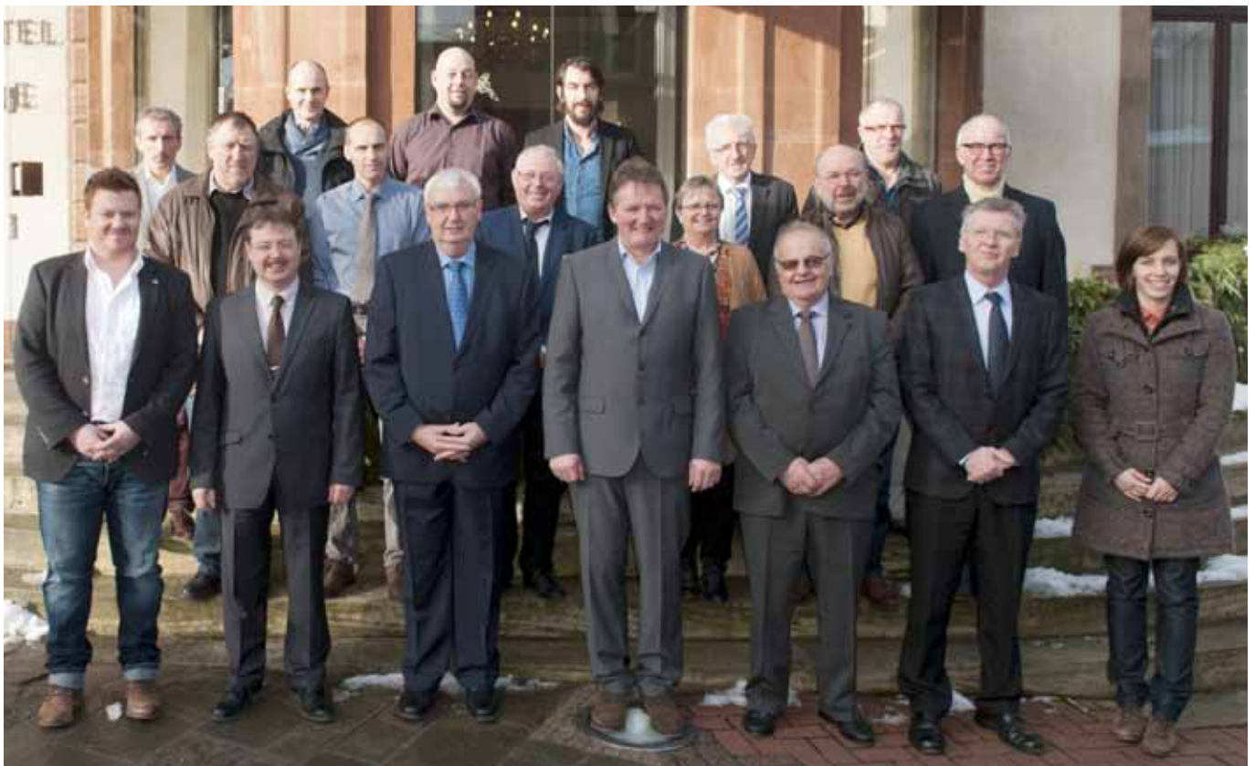
► De neie Gemengerot vun der Gemeng Wooltz

An der neier Gemeng Wooltz ginn et dann awer nach genuch Aktionspunkten mat dem geplangten Indoor Mini-Golf zu Eschweiler, Skatepark an der Kaul. Dann den Klampark an den Frichen net ze vergiessen, mat dem Ausschaffen vun engem neien Konzept fir d'Musée'en am Schlass vu Wooltz der Gare vu Wooltz. Op laang Sicht soll een den Projet Kannermuseum mat der Ënnerstëtzung vun nationalen a regionalen Initiativen beim Prabbeli zu Wooltz onbedéngt upaken, mat dem Ausbau vum den kulturellen Aktivitéiten