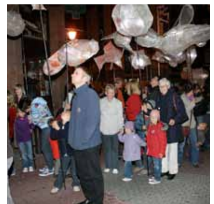
► Nuit des Lampions 2009

Im „Jardin de Wiltz“ konnte man dann die eigentliche Magie der „Nuit des Lampions“ erleben. Die Mischung des Lichts der Lampions und der Musik erzeugten Gänsehaut bei den Besuchern.