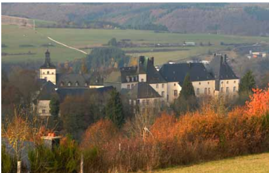
► Das Wiltzer Schloss im Oktober 2009

Am 22. September traf sich Marco Schank, beigeordneter Minister für Nachhaltigkeit und Infrastrukturen sowie Minister für den Wohnungsbau, mit den Verantwortlichen der Gemeinde Wiltz, um über die