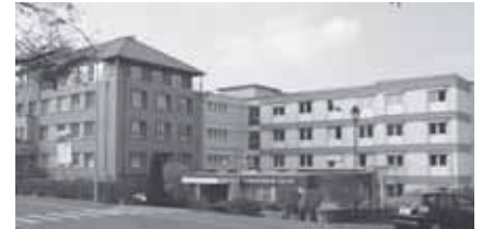
► Das CHdN Wiltz Ende 2010