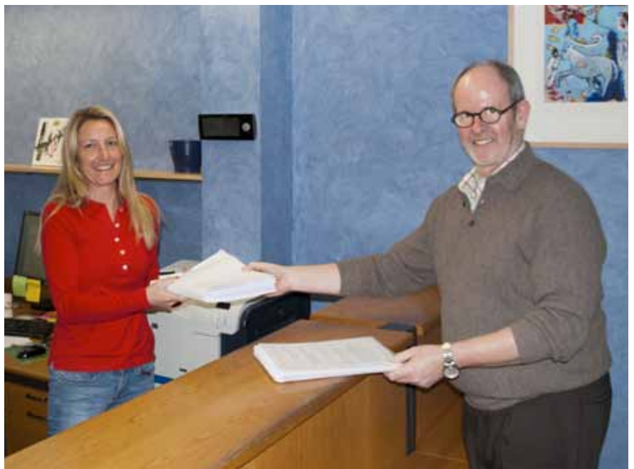
► Akten werden übergeben und archiviert