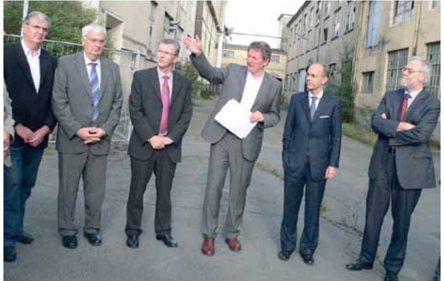
► Die Minister Frieden und Schank vor Ort

Mitte September verschaffte sich Finanzminister Luc Frieden, in Begleitung von Wohnungsbauminister Marco Schank, vor Ort einen Eindruck von den Wiltzer Industriebrachen und unterstrich denn auch die Tragweite des im Regierungsrat erzielten Durchbruchs in diesem seit 20 Jahren schleppenden Dossier. Frieden teilte mit, dass der Staat nun alle noch ausstehenden Bodensanierungskosten in Millionenhöhe übernehmen werde, für die jetzt niemand mehr haftbar gemacht werden könne. Nicht zuletzt auf Druck von Schank, der die Neubesiedlung der „Frichen“ bei seinem Amtsantritt im Jahr 2009 zur Priorität erhoben und mit den Bereichen Wohnungsbau, Umwelt und Landesplanung die drei entscheidenden Ressorts für dieses Vorhaben in seinem