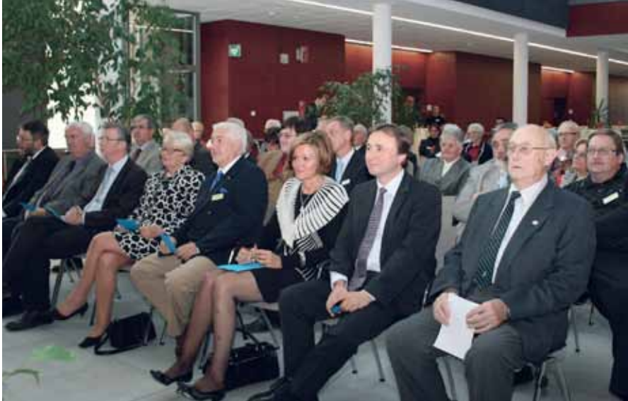
► Silbernes Jubiläum der Amicale „Amis de la Maison de Retraite“