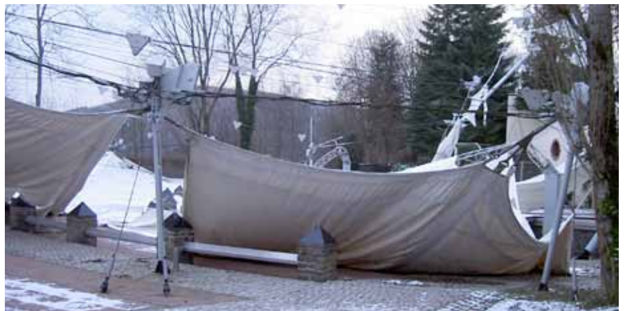
► Das Festivaldach ist eingestürzt

Durch die anhaltenden Schneefälle hatte sich eine etwa 40 Zentimeter hohe Schneeschicht auf dem Zeltdach der Freilichtbühne beim Wiltzer Schloss gebildet. Am Sonntagabend, dem 19. Dez-