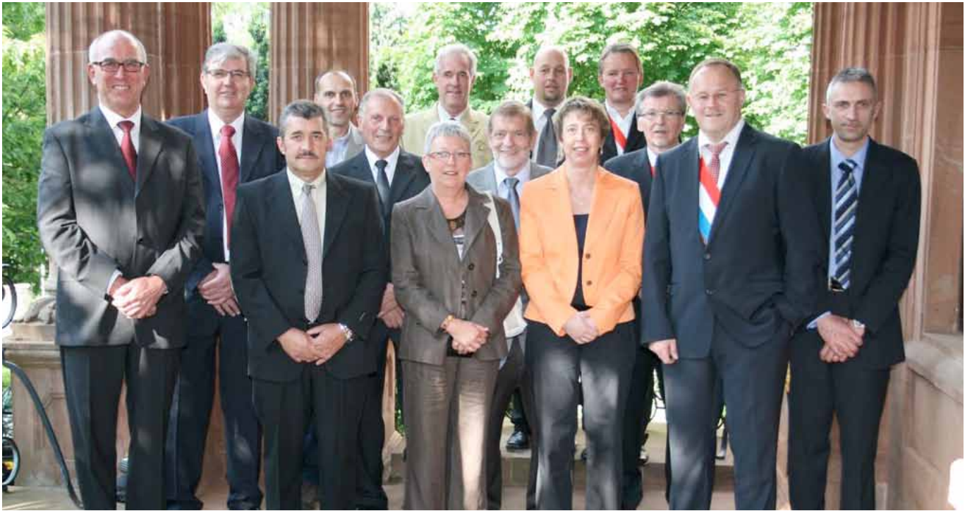
► Ehrung der „dirigeants méritants“ 2009