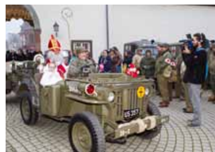
► Kleeschen 2014