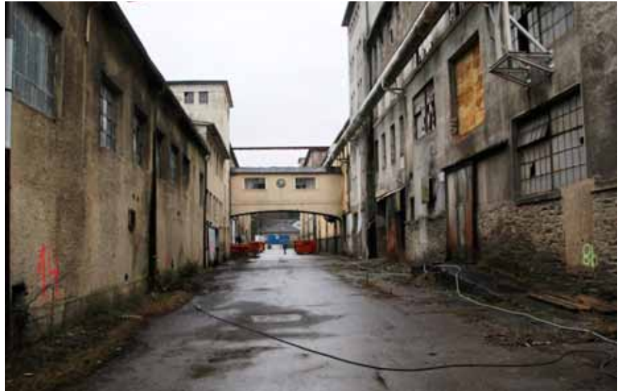
► Die Eurofloorbrachen warten auf den Abriss